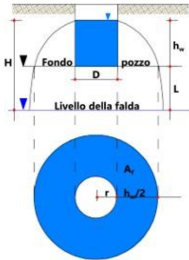
Schema di pozzo d'infiltrazione secondo F. Sieker